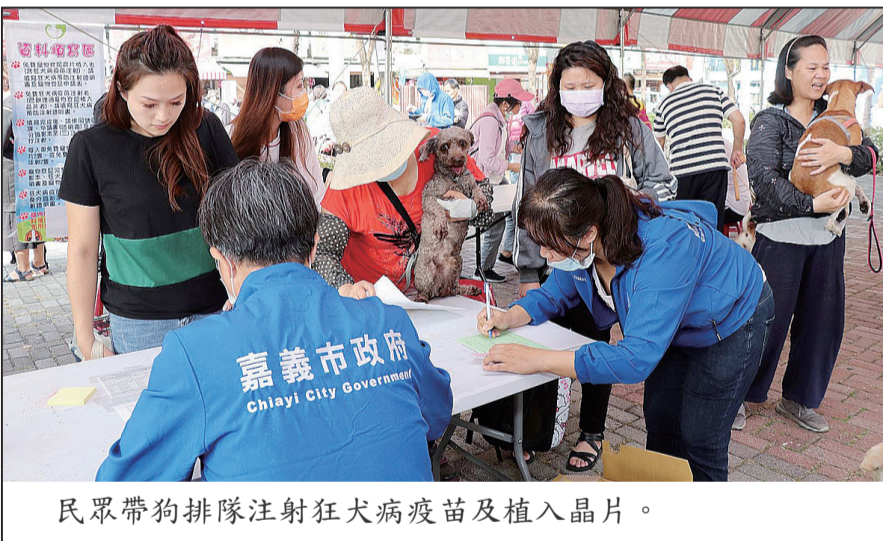
民眾帶狗排隊注射狂犬病疫苗及植入晶片。

為體現並強化《動物保護法》精神，減少流浪動物衍生問題，增進動物福利，維護公共安全，進一步促進人與動物的和諧關係，嘉義市政府制定《嘉義市動物保護自治條例》草案，也是