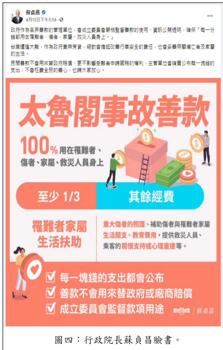
圖四：行政院長蘇貞昌臉書。