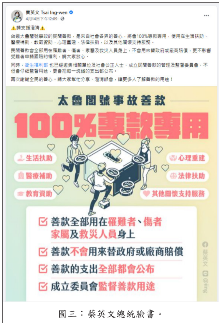
圖三：蔡英文總統臉書。