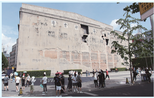
上海四行倉庫西牆，是四行倉庫抗戰紀念館重要的組成部分。

坐落於上海蘇州河北岸的四行倉庫抗戰紀念館日前正式掛牌「上海市對臺交流基地」，成為滬臺深化交流交往的又一重要空間和載體。