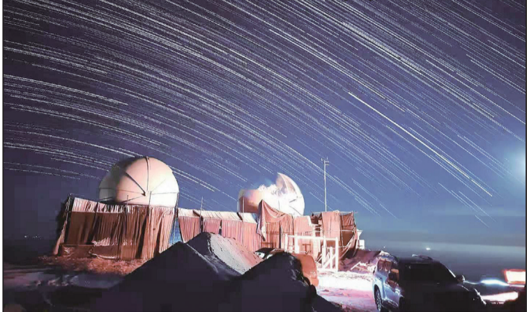
青海「火星小鎮」打造成世界級天文觀測基地，圖為冷湖鎮賽什騰山的星空。

地處大陸青藏高原柴達木盆地西北邊緣的冷湖鎮，常年寒冷多風，乾旱少雨，晝夜溫差大，四季不分明，年均氣溫攝氏四度，屬典型大陸性氣候。因有著規模宏大、形態各異的雅丹地貌，猶如外星球表面，被國內外遊客稱為「火星小鎮」。