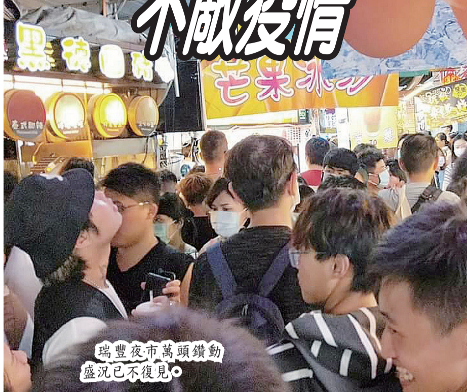
瑞豐夜市萬頭鑽動 盛況已不復見。