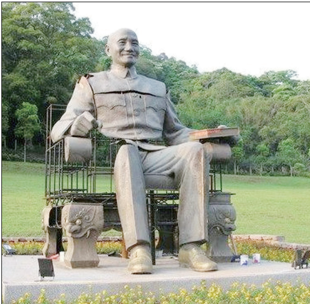
原高市中正文化中心的蔣公銅像被拆除後，於大溪「蔣公銅像公園」勉強拼湊還原。

銅像神秘力量存在與否，現階段還是無法用科學來解釋，促轉會如果覺得自己八字夠硬，虧心事做得還不夠多，倒是可以再一次來驗證看看蔣公的鄉野傳說到底是真是假。（記者／崔家琪）