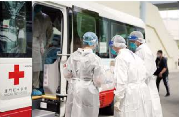
紅十字會車輛投入演練。