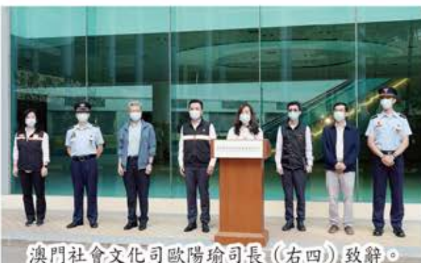
澳門社會文化司歐陽瑜司長(右四)致辭。

為應對大規模新冠肺炎疫情，澳門特別行政區政府制定一系列的應急處置預案，包括於澳門東亞運動會體育館內設置「新型冠狀病毒感染社區治療中心」(下簡稱社區治療中心)以便隨時啟動，應對可能出現的大量感染者。為強化社區治療中心在跨部門運作方面的實施成效、溝通協同及聯動能力，新型冠狀病毒感染應變協調中心於日前舉行了社區治療中心第一次跨部門演練，並由社會文化司歐陽瑜司長、中聯辦宣傳文化部萬速成部長、警務聯絡部王志剛部長、衛生局羅奕龍局長、社工局韓衛局長、衛生局郭昌宇副局長及鄭成業副局長等到場觀察演練過程。