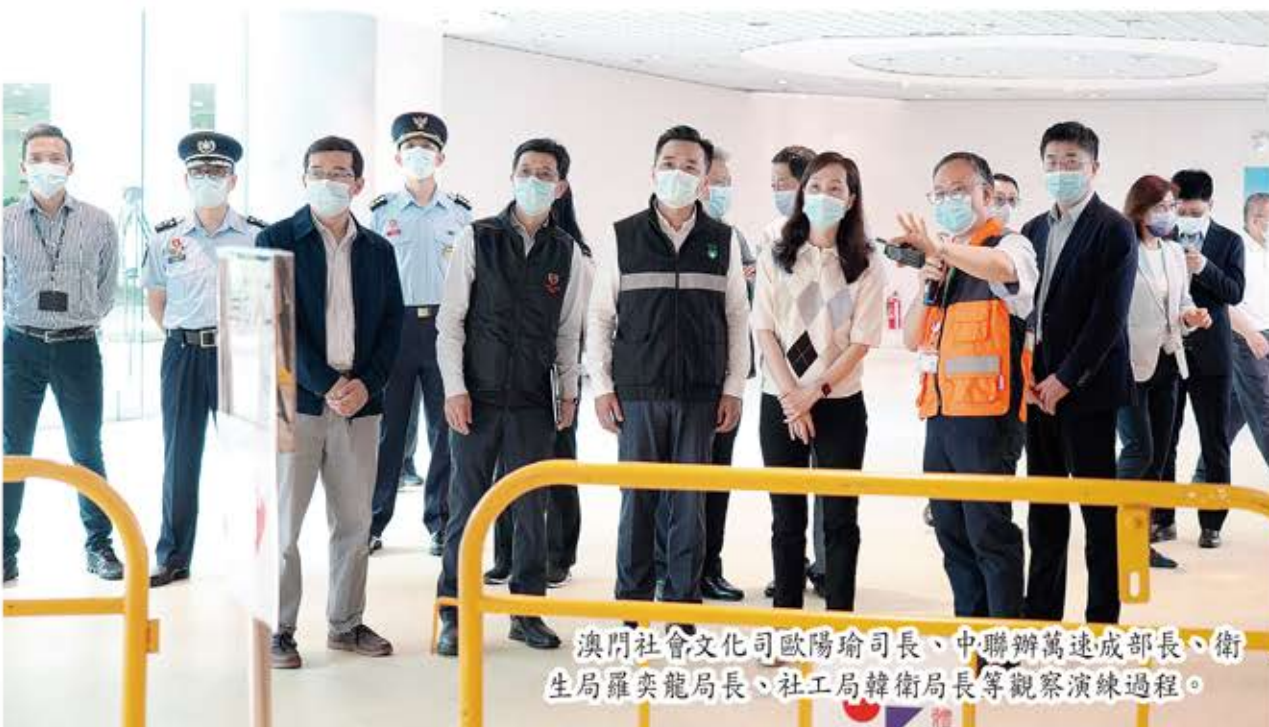
澳門社會文化司歐陽瑜司長、中聯辦萬速成部長、衛生局羅奕龍局長、社工局韓衛局長等觀察演練過程。

是次演練於 7 日早上 9:45 開始，為了讓公眾能夠深入認識社區治療中心的運作，仁伯爵綜合醫院李偉成醫務主任、疾病預防及控制中心林松主任、治安警察局策劃行動廳李志輝廳長、消防局澳門行動廳張智宏代廳長、交通事務局交通管理廳何振濤代廳長、澳門紅十字會宋文珠副總監對演練過程作即時講解及回答提問，包括一般情況下的市民運送流程；於大規模疫情期間如何使用公共交通運輸工具例如大型公共巴士、的士等，由社區快速且有效地將疑似感染者、不同類別的