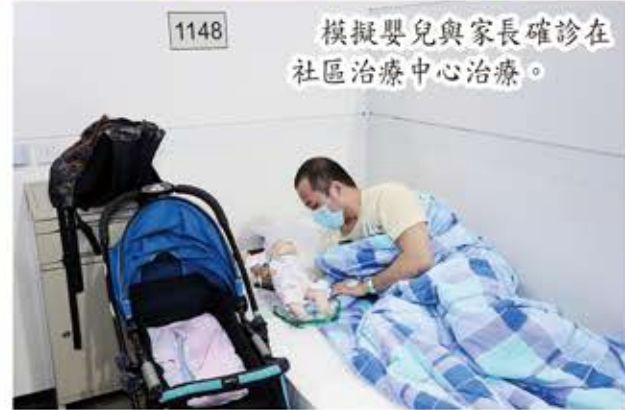
1148 模擬嬰兒與家長確診在社區治療中心治療。