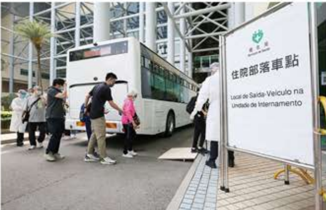
大型巴士投入演練。

的流程與仁伯爵綜合醫院急症部的一樣，即先登記患者資料，根據其情況安排就診次序，先處理發燒或血壓不正常等人士；若患者經醫生判斷情況危急，會轉送醫院，不留在社區治療中心診治。