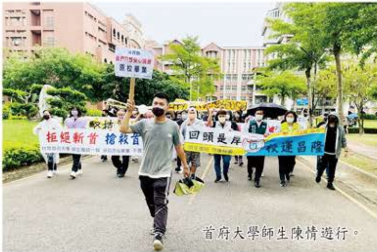
首府大學師生陳情遊行。

少子化問題對高中以上私校造成嚴重衝擊，許多私校開始出現招不到學生的窘態。近十年來已有七所私立大專校院進入停辦退場名單，尤其從二〇一八年開始，年年都有受害者，最近台南的台灣首府大學及高雄的高苑科大，不約而同因學校與董事會之間的爭議，可能成為下一批被迫退場的私大。