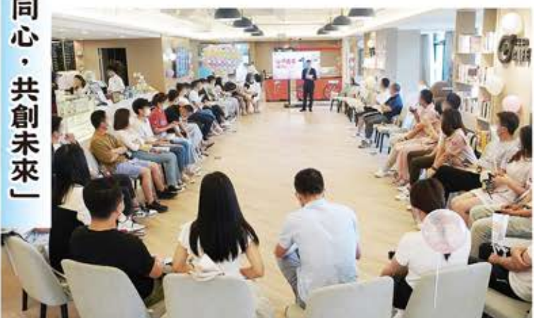
2022年琴澳青年聯誼會主打「琴澳同心，共創未來」。

5月21日下午，在廣東橫琴粵澳深度合作區AHA港澳青年孵化中心7樓，由廣東省委橫琴工委黨建工作處指導，AHA港澳青年孵化中心主辦，橫琴新階聯支持的「琴澳同心，共創未來」琴澳青年聯誼會順利舉行。