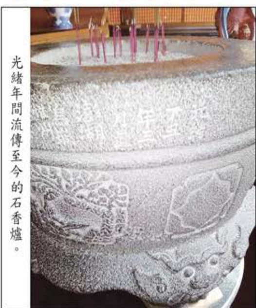
光緒年間流傳至今的石香爐。