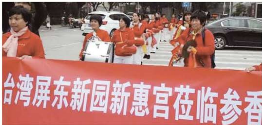
→鎮殿媽祖金身。 ←新惠宮到廈門交流。