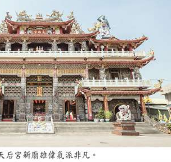
路竹天后宮新廟雄偉氣派非凡。

旱地噴出泉水六天後化為神火 民國六十八年七月三日，聖母指示此地，地理好、地屬龍穴，興建大廟，地靈人傑，社里平安，冀望委員信徒合同一心，全力合作，順天行事。同年九月一日，聖母發爐一再指示，先動土典禮擴建新廟，並經過六 天聖母奇蹟展現，在乾燥旱地噴出泉水，聖母命名「金鳳泉水」，賜眾信徒乞飲保平安，再經過六天，泉水化為神火，火焰高度約五台尺以上，火光中隱約可見聖母神像，益發受信徒膜拜。 民國七十六年九月底全部工程順利完成，十一月二十八日（農曆十月六日），舉行建醮大典。完成後的鋼筋混凝土建築雄偉堂皇，壯觀瞻仰、神