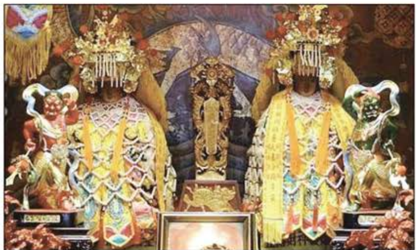
← 一路竹天后宮主祀媽祖。 → 一路竹天后宮舊廟見證先民開拓史。