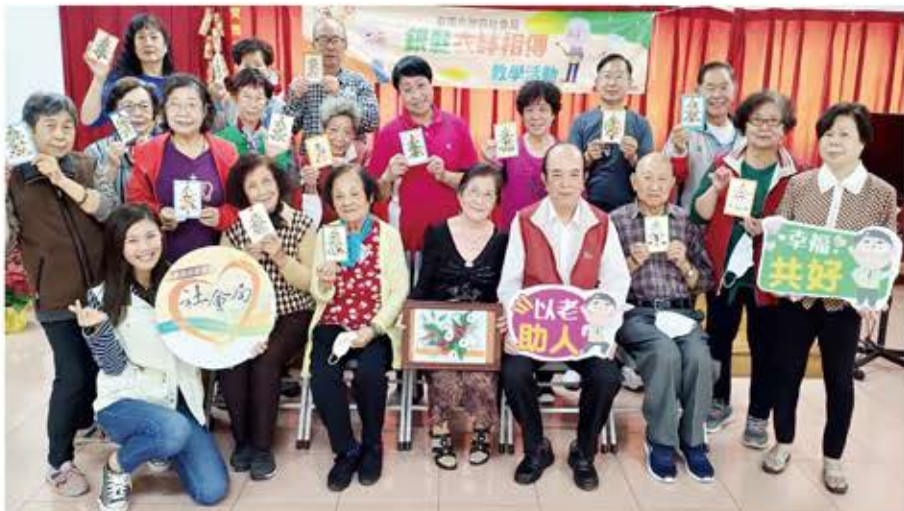
台南市政府積極推動銀髮衣鉢相傳計畫，盼發揮長者「銀」響力，實現「活躍老化」目標。

雲西沿海產業困境，積極推動智慧綠色漁業產業區開發事宜，經濟部工業局一一〇年七月核定本計畫，補助經費230萬元。張縣長為克服海線貨運不便情形，並尋求行政解套，持續推動麥寮港改制國際商港，一一〇年四月請經濟部王美花部長儘速興建南公用碼頭，經濟部於一一〇年九月同意興建，以達到地盡其利、增加就業機會、創造地方繁榮發展。 在張縣長努力不懈推動麥寮工業港開發下，環保署於八月廿五日專案小組第二次會議結論對於麥寮工業港變更環境影響評估審查結論已要求未來通過後必須限期開發，依據開發單位表示，麥寮工業港南公用碼頭倘取得施工許可後預計二〇二七年可完工，屆時可配合台西區廠商需求，由南碼頭進出口貨物，發揮麥寮港最大功效及周邊產業區發展利基，整合貿易轉運、工業製造、農業產銷及觀光遊憩功能，對雲林縣沿海地區進行分區規劃，促進地方產業轉型與升級，以留住青年人口。