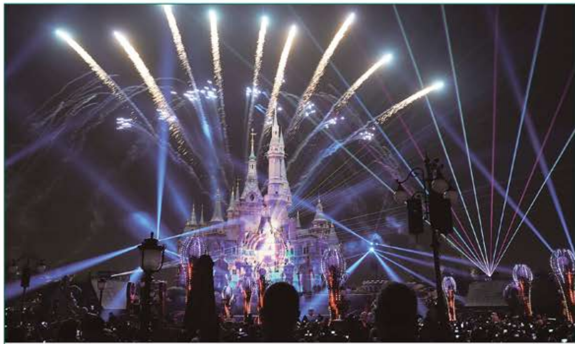
上海新增 6 處夜間文化和旅遊消費集聚區，圖為上海迪士尼樂園全新的焰火燈光秀亮相。

新入選區域包括豫園片區、西岸美術館大道、安福路文藝街區、新華歷史風貌街區、大寧片區、上海國際旅遊度假區核心區等。其中，豫園文化夜經濟發展態勢良好，以「光、秀、市」為主要內容，升級和延伸傳