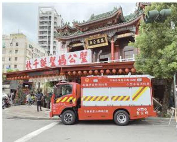
萬應公廟捐贈小型水箱消防車。

據說向祂許願相當靈驗，但當願望達成之後如不還願，便會病魔纏身，直到還願為止。賭徒也喜歡來此祭拜，一般相信祂能使手氣較差的賭徒扳回老本，假如佩帶觀音佛像香火前