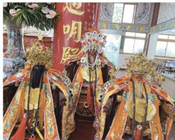
萬應公廟主祀的三尊神明。