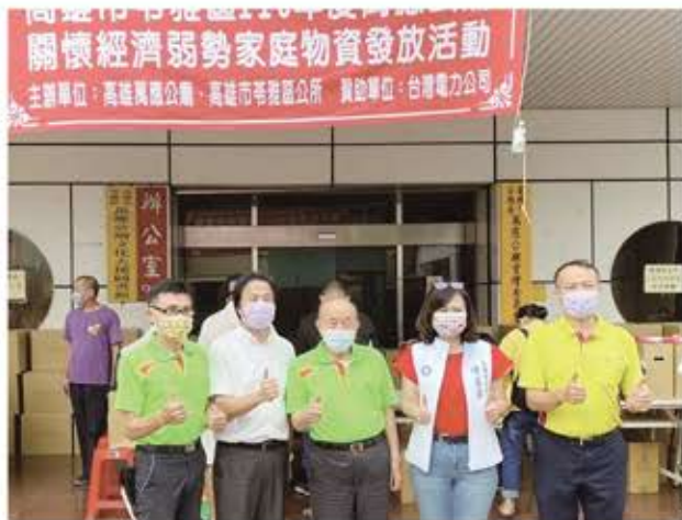
萬應公廟熱心公益活動。