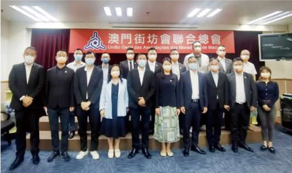
←澳門經濟民生聯盟拜訪澳門街坊會聯合總會，就多項議題交流意見，雙方合照留念。