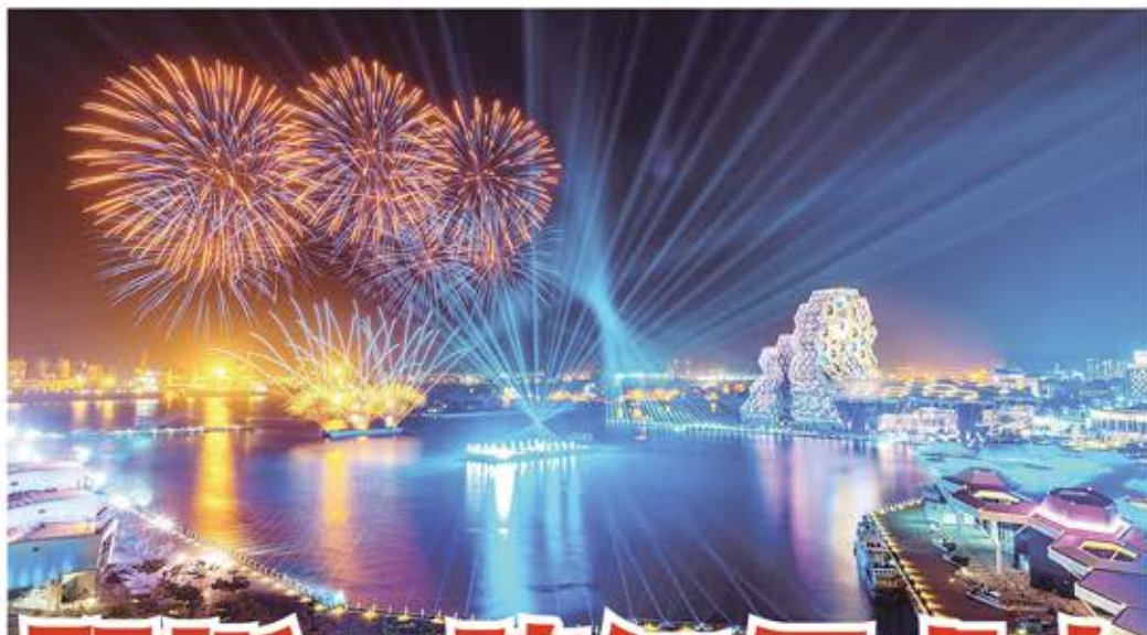
奪人眼目的愛河灣花火 (左圖)。3D 模擬未來式舞台 (下圖)。