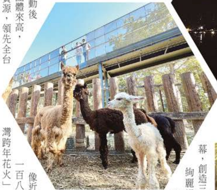
↑ 無人機展演示意圖。 ← 壽山動物園迎賓。 ↓ 高雄輕軌龍貓隧道。