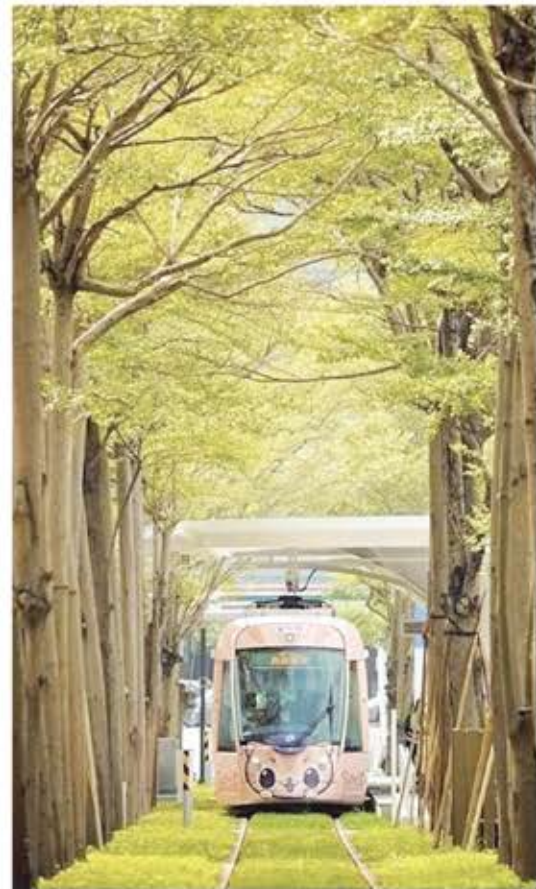
↑ 無人機展演示意圖。 ← 壽山動物園迎賓。 ↓ 高雄輕軌龍貓隧道。