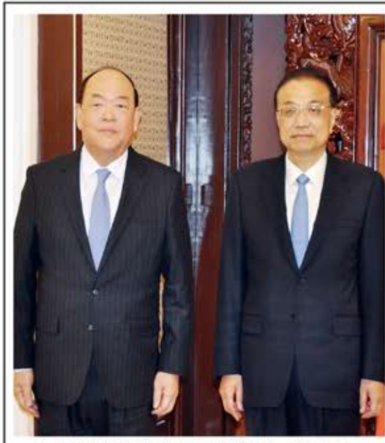
大陸國務院總理李克強與賀一誠會面。