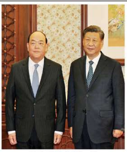
習近平親切接見賀一誠。

實二十大精神和習主席重要論述、批示精神，按照「提振經濟，促進多元，紓解民困，防疫」的發展總體方向，有效把握國家發展機遇，用好用足中央支持澳門發展各項政策，積極推動經濟復甦，切實改善民生，加快