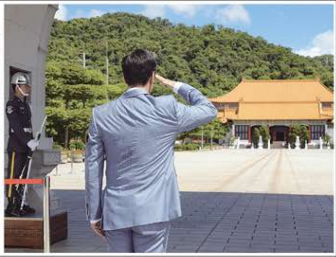
→ 郭台銘董事長罵人引經據典：「廟堂之上，殿陛之間」。

更讓許多人想起二〇一五年「台灣王爺總廟、南鯤鯓代天府」依古禮抽出國運籤「武則天坐天」，籤首是「武則天坐天」，引起隱喻蔡英文要做女